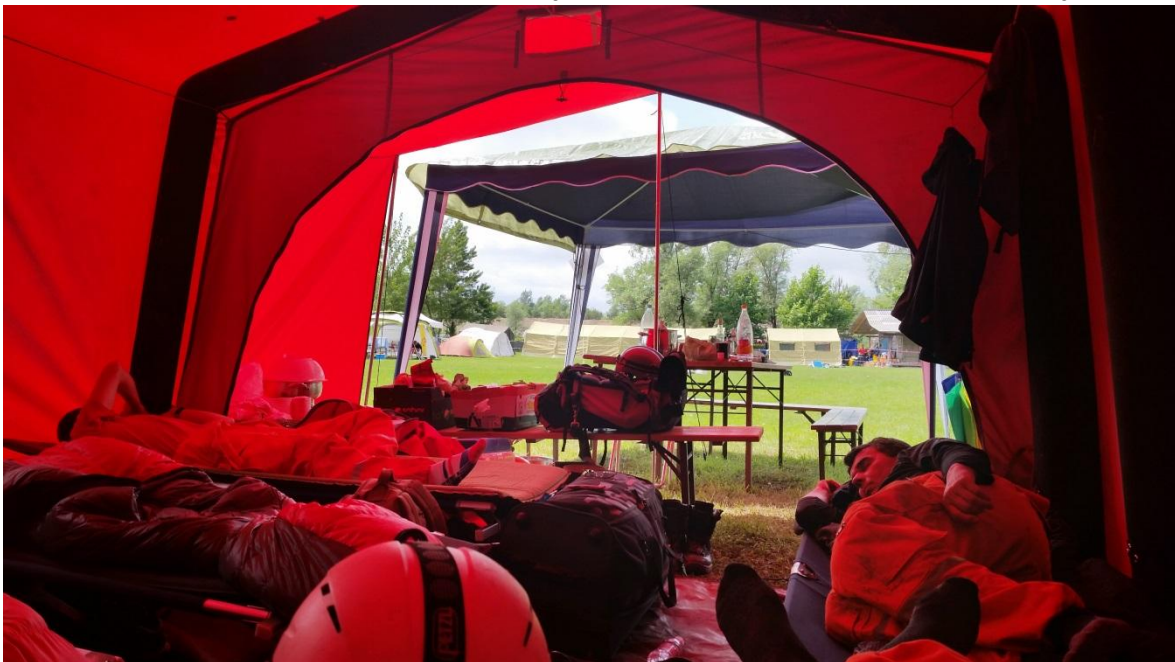
Počitek med nalogami

V petek, 15. 5., smo ob 16. uri prispeli v bazni tabor (poligon DVRPS), kjer smo si najprej postavili šotor in se opremili z vsem potrebnim za delo in bivanje v času vaje. Pravilo namreč določa, da mora biti vsaka ekipa v času vaje samooskrbna in neodvisna od zunanje pomoči.