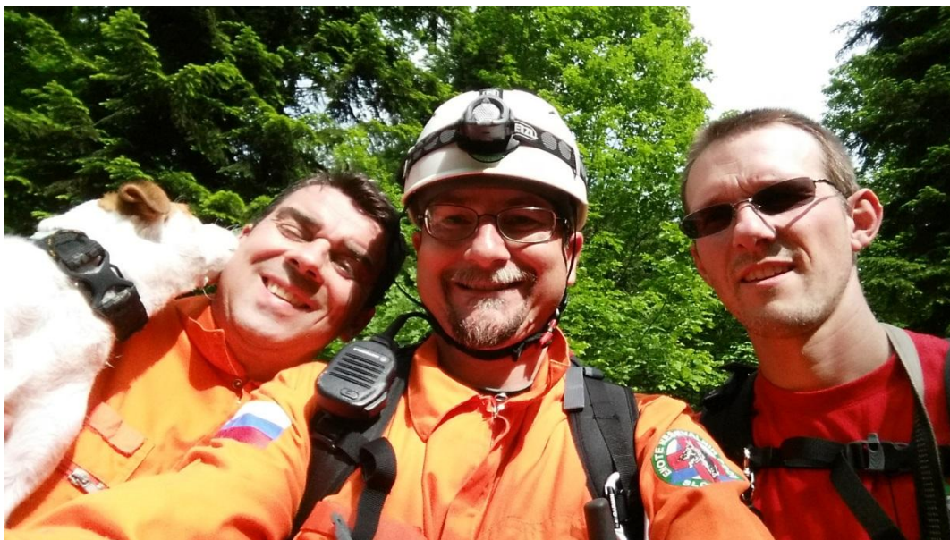
Zadovoljni z opravljenim delom