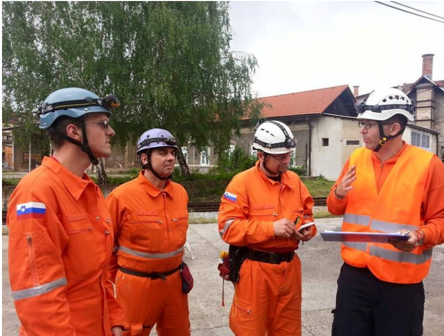
Izdelava strategije pred iskanjem